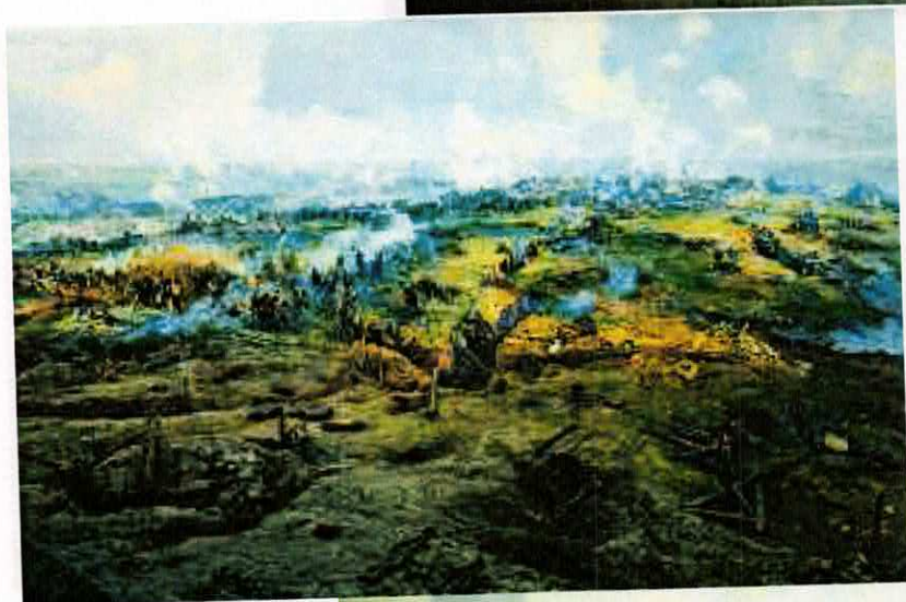
Imagini din interiorul Panoramei de la Plevna reprezentând diversele scene ale bătăliilor duse în Războiul de Independență