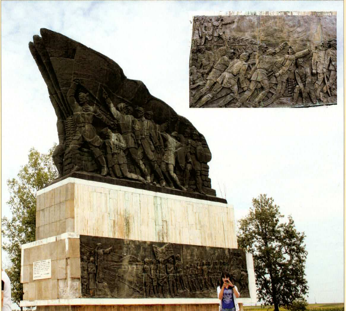
Monumentul Independenței de la Siliștioara, Corabia