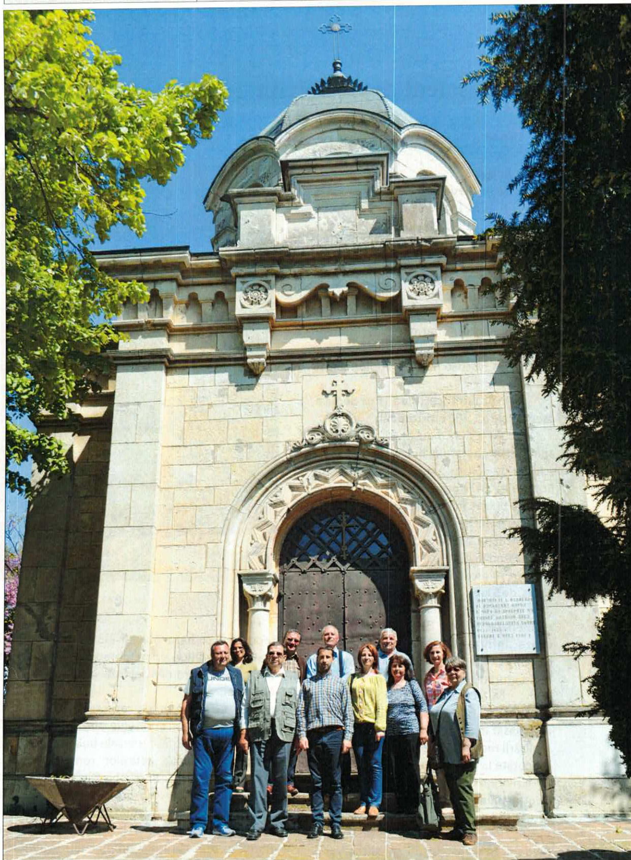
În fața Mausoleului de la Grivița - 1 mai 2015