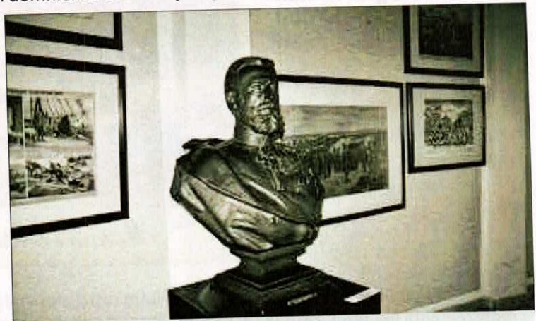
Bustul Regelui Carol I la Panorama din Plevna

activitate propagandistică de către românii aflați în diferite state europene, în încercarea de influențare a opiniei publice-internaționale în favoarea intereselor românești. După abdicarea lui Cuza, prin variate forme politice și diplomatice, s-a desfășurat prin intermediul românilor din străinătate o amplă activitate propagandistică pentru influențarea opiniei publice internaționale și crearea