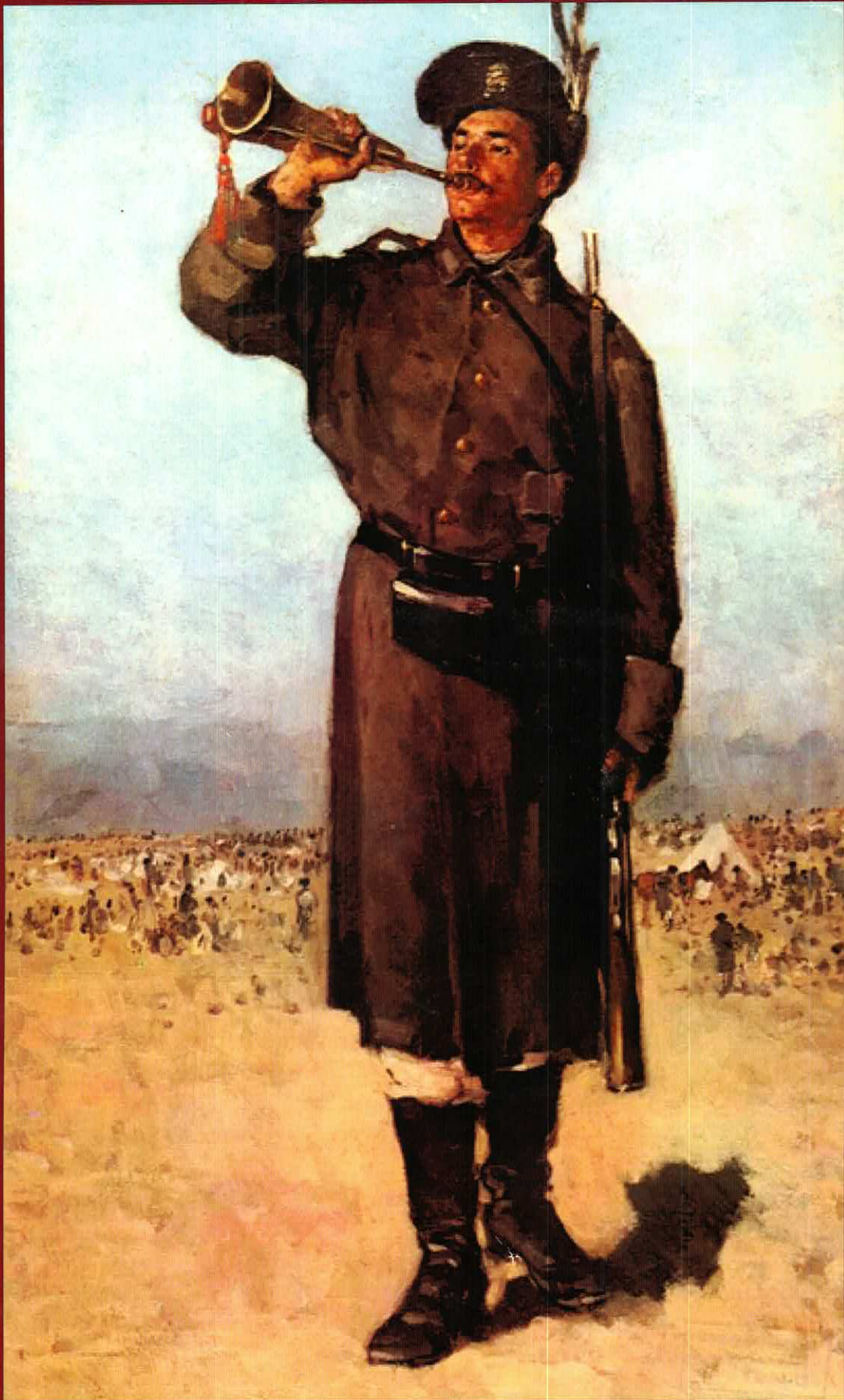
Gornistul - pictură de Nicolae Grigorescu