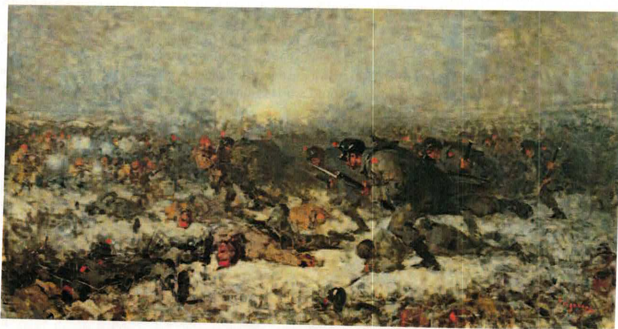
Atacul de la Smârdan - pictură de N. Grigorescu