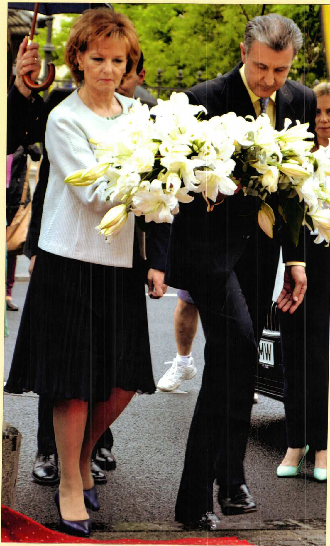
ALLRR Principesa Moștenitoare Margareta și Principele Radu depunând flori la Statuia Regelui Carol I din București - 10 mai 2015